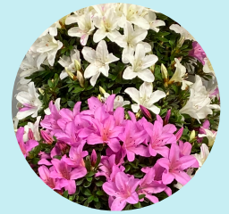
Blüte im Mai

ins alte Holz treibt sie erneut aus. In kalten Wintern ist es durchaus normal, dass die Azaleen teilweise ihre kleinen lederartigen Blätter verlieren.