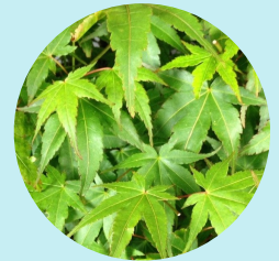
Laub im Sommer Austrieb

braune Blattspitzen zu bekommen. Der Fächerahorn ist leicht zu gestalten und recht pflegeleicht. Die spektakuläre Blattfärbung im Frühjahr und Herbst, sollte in keiner Bonsaisammlung fehlen.