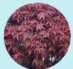
Laub eines Roten Fächerahorn